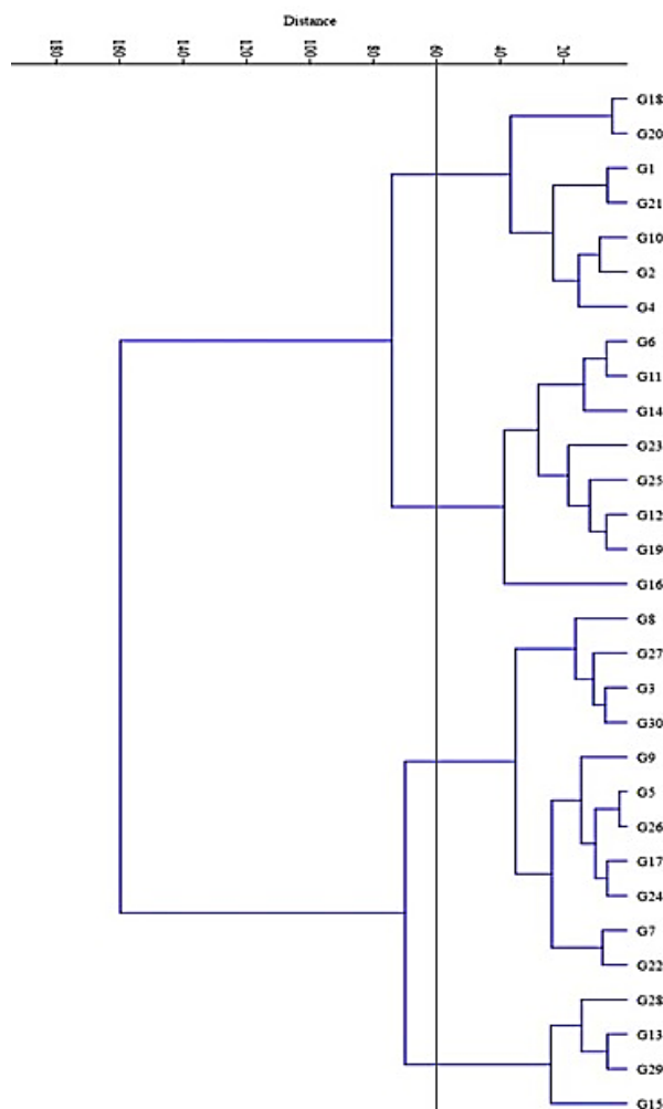
شکل ۱- دندرو گرام ترسیم شده بر اساس روش Ward برای ۳۰ توده مختلف هندوانه مورد مطالعه